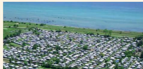
Hohe Leuchte am Lensterstrand: Camping direkt an der See.

Zusätzliche PKW am Stellplatz nur nach Rücksprache. Stellplatzgröße Feriencamping 80 m 2 , mit Strom-, Wasser- und Abwasseranschluss. Die Kurabgabe/Ostseecard wird nach den geltenden Sätzen zusätzlich erhoben.