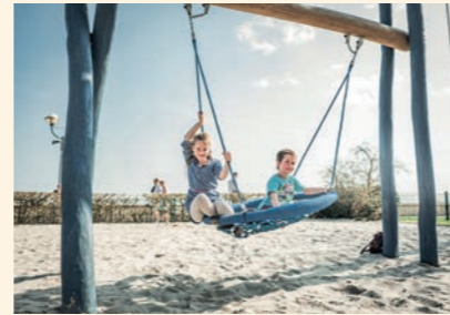
Gepflegte Außenanlagen, schattige Plätzchen und viel Platz zum Spielen – darauf legen wir Wert.